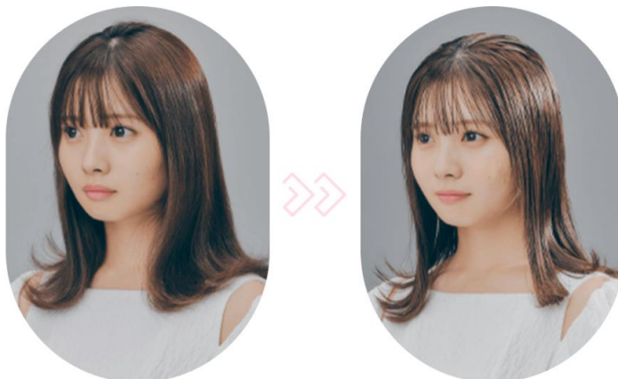
仕上がりイメージ

リッチな艶のある束感をつくり、艶やかにまとまったヘアスタイルに。また、なじませやすいミルク in ジェルでバリッと固めずに繊細な毛流れとウェットな質感をキープします。