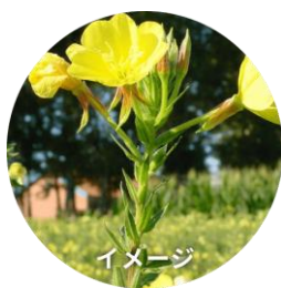
濡れツヤキープオイル （保湿成分） 月見草油

濡れツヤキープオイルとして、月見草油（保湿成分）を配合。また毛髪トリートメント成分として加水分解ケラチン、セラミド NG を配合しています。