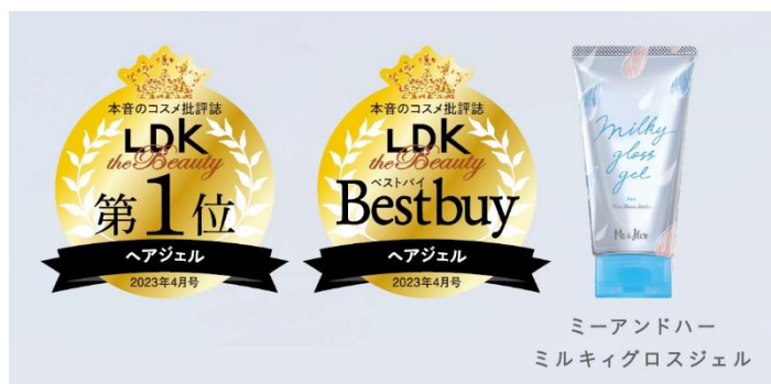
ミーアンドハー ミルキィグロスジェル

※2 受賞商品「ミーアンドハー ミルキィグロスジェル」『LDK the Beauty』2023 年 4 月号ヘアジェル部門にて、第 1 位およびベストバイを獲得