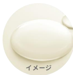
W 毛髪トリートメント成分 加水分解ケラチン セラミド NG