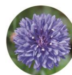
ヤグルマギクエキス