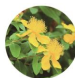
セイヨウオトギリソウエキス