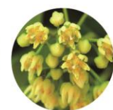
フユボダイジュエキス