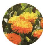
トウキンセンカエキス