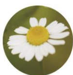
ローマカミツレエキス