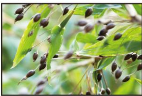
※ハトムギ種子エキス・加水分解ハトムギ種子