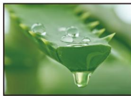
オーガニック認証機関(OTCO)認定